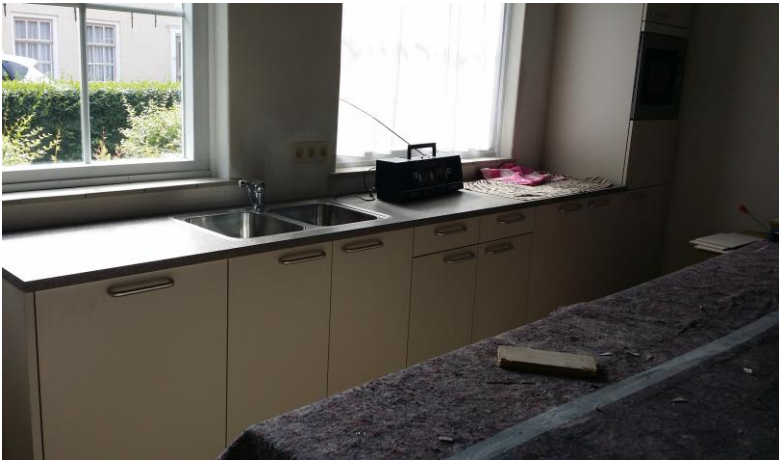
Nieuwe keuken is geplaatst