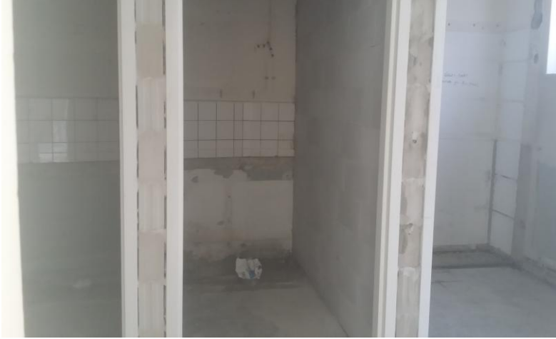
Indeling nieuwe toiletten